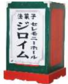
法菓子 ¥5,000 (50ヶ入)