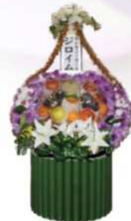
果物盛 ¥15,000 ¥13,000