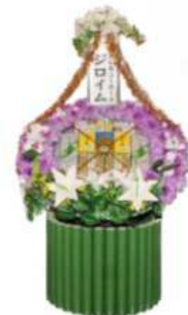
練香盛 ¥10,000 ビール盛 ¥10,000